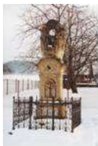
Žďáru, restaurátor, tato památek. Pro jenom omezené