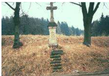
Na snímku je kříž, který je umístěn na hranici Levínské Olešnice.

Je nutno konstatovat, že uvedené částky jsou pro tak malou obec jako je naše poměrně vysoké. Ale i přes to nachází zastupitelstvo pro tuto záslušnou činnost mezi občany pochopení. Prakticky každým rokem obecní rozpočet s touto potřebou kalkuluje. Na snímku jsou zachyceny kulturní památky nacházející se v katastru obce.