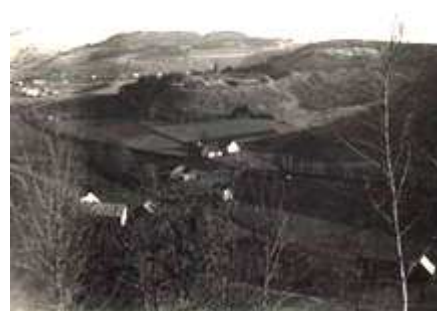
na snímku pohled na hradiště Levín z r. 1900