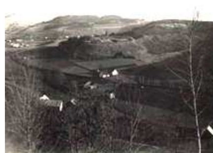
na snímku pohled na hradiště Levín z r. 1900