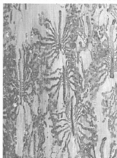
požerky pod kůrou