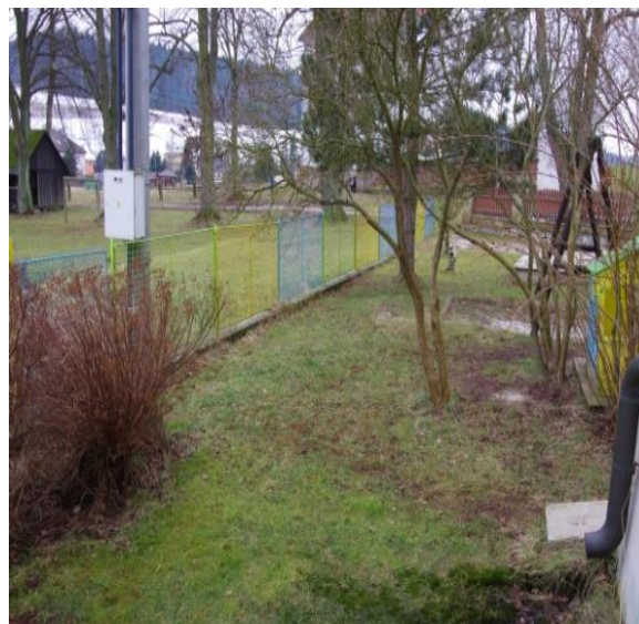
nový plot (plast)