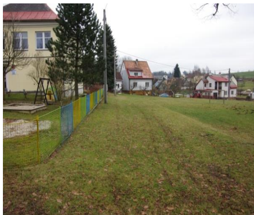
prostor pro herní prvky