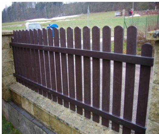
nový plot plast (bez betonových sloupků)